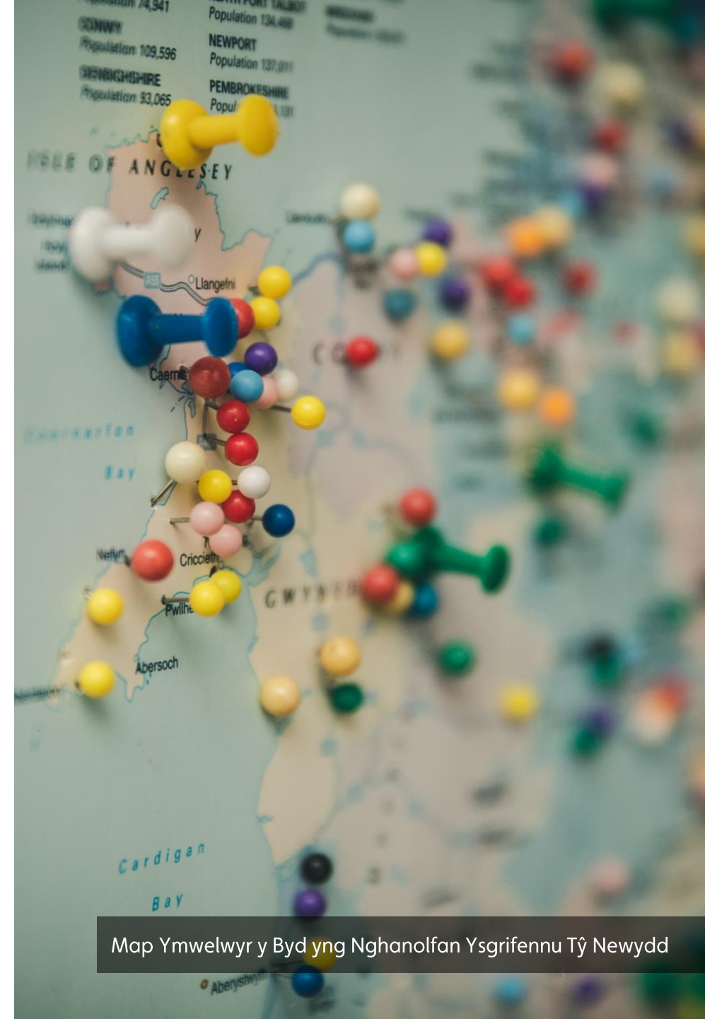
Map Ymwelwyr y Byd yng Nghanolfan Ysgrifennu Tŷ Newydd

Erbyn hyn, rydym wedi cyrraedd y camau olaf o weithio gyda BBC Cymru i gyhoeddi enillydd Llyfr y Flwyddyn eleni'n fyw ar yr awyr. Byddwn yn parhau i weithio gyda'n partneriaid i ddatblygu cynnwys cyffrous, gan gynnwys sgysiau panel, darlenniadau a gweithgareddau rhyngweithiol, er mwyn rhoi llwyfan i'r gymuned lenyddol fywiog yma yng Nghymru a thu hwnt.