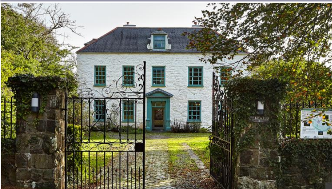
Penwythnos Beirniaid Ifanc yn Nhŷ Newydd fel rhan o'n Cynnig Addysgol. Cliciwch fan hyn i ddarllen am brofiad un a gymerodd ran