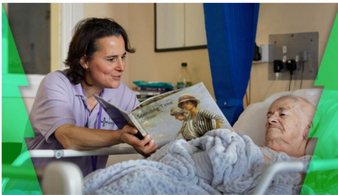
Dewis The Reading Agency a Ffrindiau Darllen ar gyfer Apêl Nadolig The Times 2019. Mae rhagor o wybodaeth fan hyn .