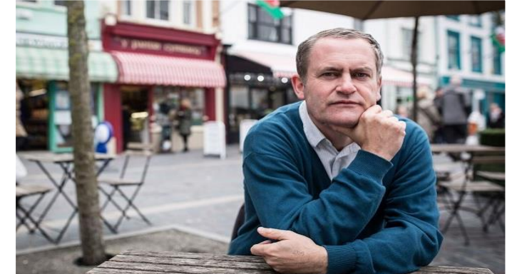
Bardd Cenedlaethol Cymru yn perfformio yng Ngŵyl Transoesie ym Mrwsel wrth roi llwyfan i Ddiwylliant Llenyddol Cymru