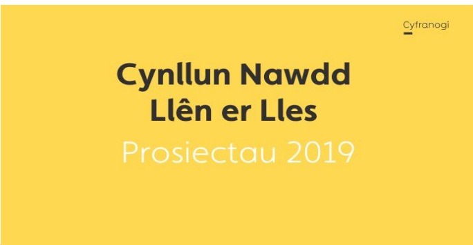
Prosiectau arloesol a chynhwysol wedi'u lansio ar gyfer amrywiaeth o grwpiau, gan gynnwys carcharorion a ffoaduriaid.