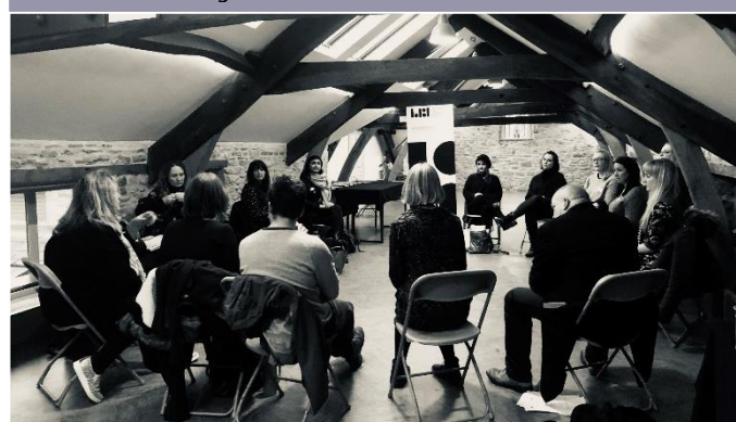
Cymerodd 12 o awduron ar ddechrau'u gyrfaedd ran mewn diwrnod rhwydweithio a diwrnod i'r diwydiant ym Mhenwythnos y Gaeaf Gŵyl y Gelli .