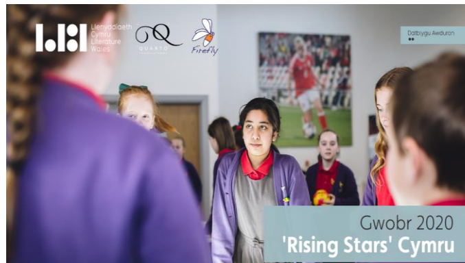
Lansio 'Rising Stars' Cymru mewn partneriaeth â Firefly Press i ddod o hyd i feirdd plant talentog o gefndiroedd Du, Asiaidd a Lleiafrifoedd Ethnig.